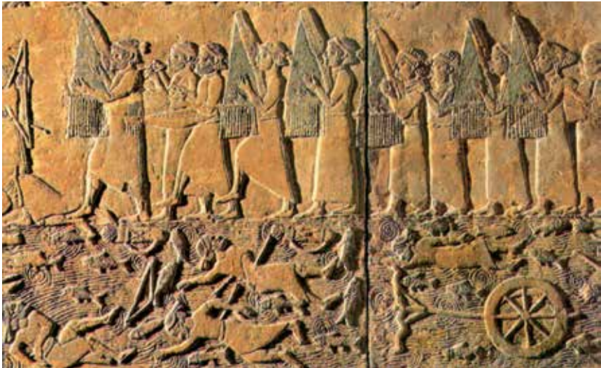
Asirija, reljef asirske prijestolnice Ninive prikazuje elamitske glazbenike koji sviraju na uspravnim harfama slaveći pobjedu.