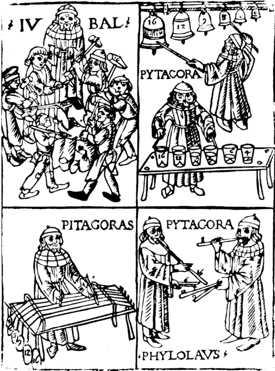
Pitagorina otkrića u staroj Grčkoj postavila su osnovne zakone akustike dokazujući da visina tona ovisi o dužini cijevi, povisujući se dijeljenjem žice monokorda na 2, 3, 4 i više jednakih dijelova.