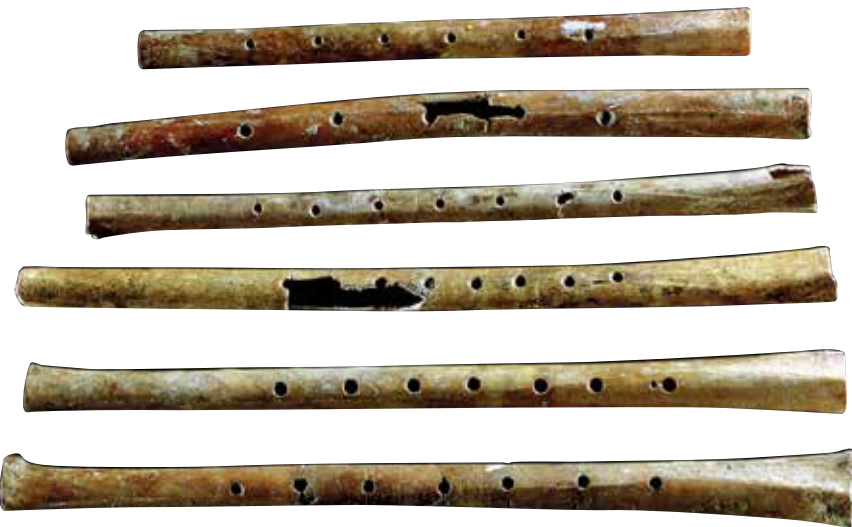
Najstarije flaute od kostiju neandertalaca pronađene 2009. godine u njemačkoj špilji stare su preko 40 tisuća godina.