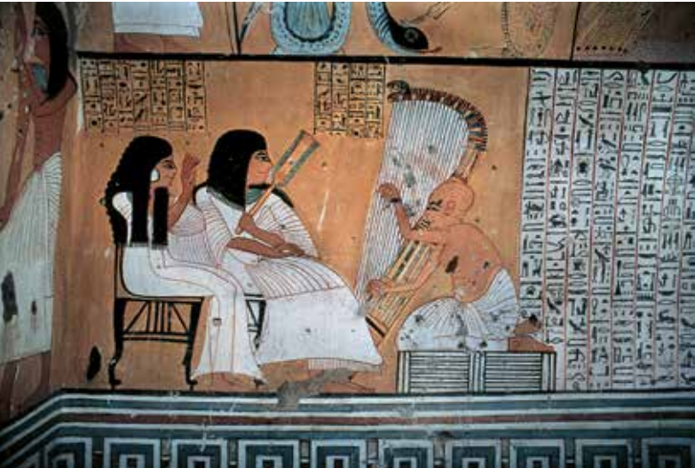
Egipat, 13. stoljeće pr. Kr. Mural u grobnici Sennedjema prikazuje glazbenike toga vremena. Amon Ra , vrhunsko božanstvo staroga Egipta, sluša crkvenoga svirača koji svira harfu.