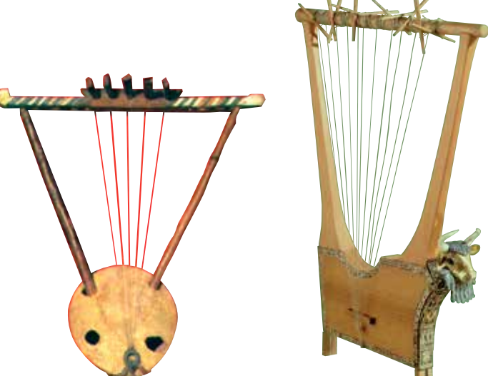
Abesinska i mezopotamska lira