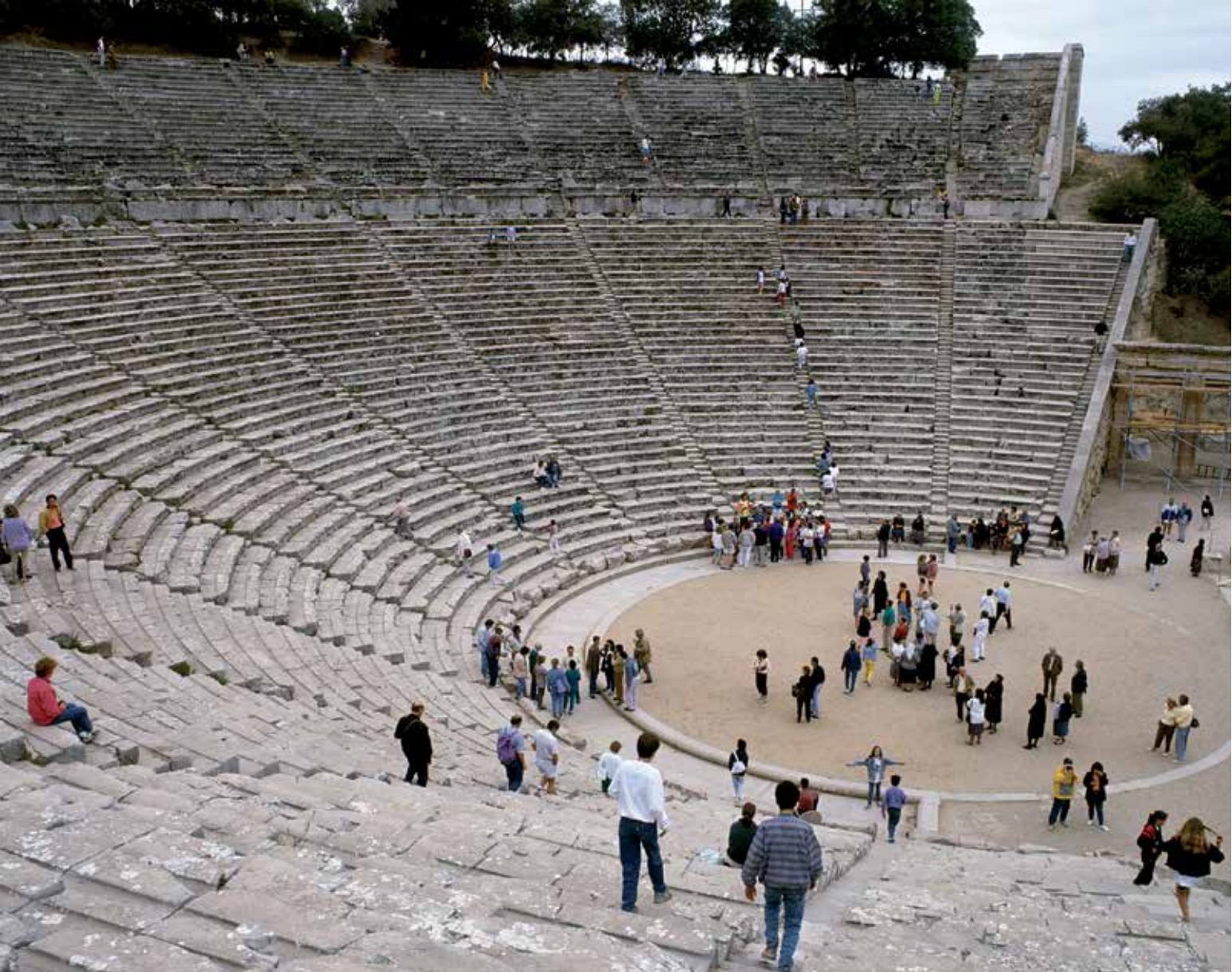
Amfiteatar na Peloponezu u Grčkoj svjedoči o tradiciji grčke tragedije , umjetničkome izrazu toga vremena koji je objedinjavao glazbu, ples, poeziju i glumu.