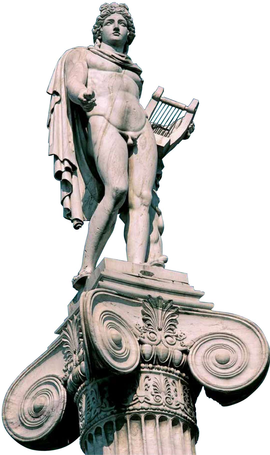
Apolon , bog muzike i poezije u staroj Grčkoj, štivali su ga kao boga Sunca, sklada i ljepote.