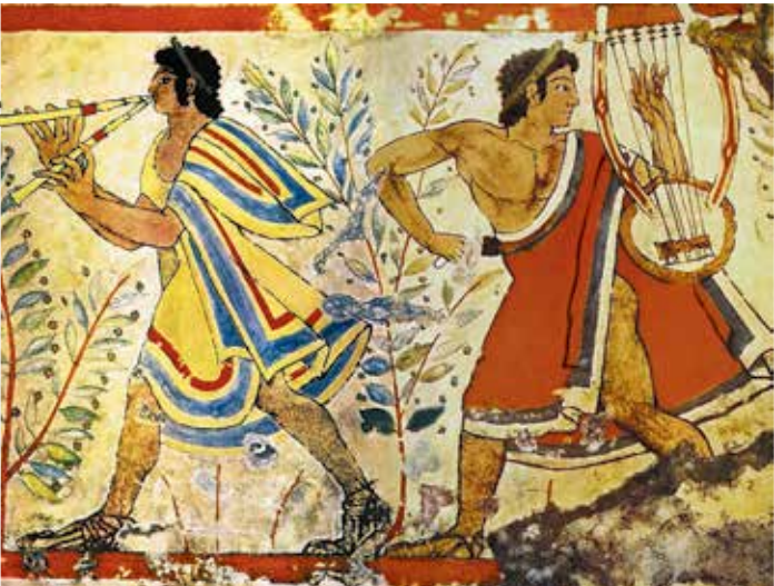
Etrurska grobna slika iz tarkvinske dinastije (7. stoljeće pr. Kr.) prikazuje svirače diaulosa i lire.