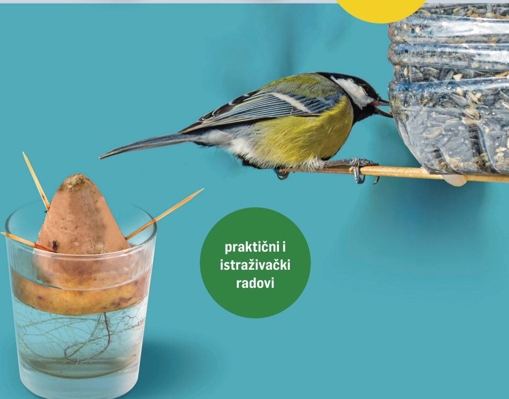
praktični i istraživački radovi

Praktične i istraživačke radove uvijek treba izvoditi uz nadzor učitelja ili druge nadležne odrasle osobe. Pribor je poželjno čuvati i više se puta njime koristiti, a prirodni materijal kompostirati ili zasaditi, odnosno vratiti u njegovo stanište.