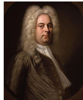
Georg Friedrich Handel