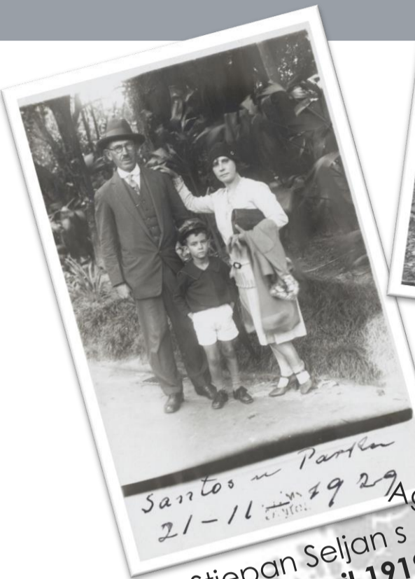
Stjepan Seljan s obitelji, Brazil 1919. g.

„Kroz pustinju i prašumu”. Ostvarenim nebrojenim i odvažnim istraživačkim putovanjima postali su najistaknutiji hrvatski istraživači i pustolovi. U svojim istraživačkim misijama na kojima su izrađivali karte i tražili rudna bogatstva posjetili su Afriku, Južnu i Sjevernu Ameriku, Europu i Aziju te upoznali različite kulture i zemlje.