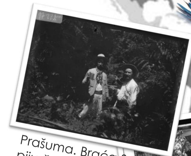
Prašuma. Braća Seljan piju čaj. Brazil, 1903. g.

Mapa Južnih provincija. Izradio Mirko Seljan. Etiopija, 1900. g.