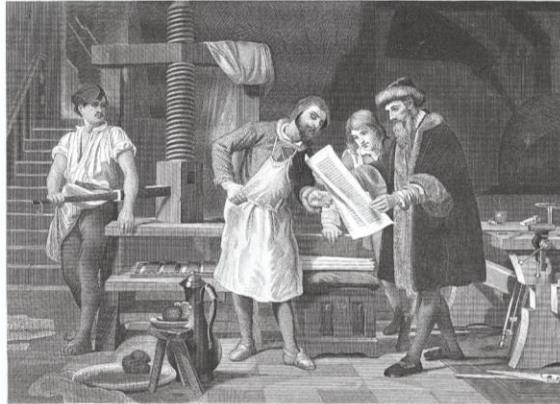
Stroj za tiskanje knjiga

Izumili su stroj za tiskanje knjiga, otkrili da je Zemlja okrugla i da se vrti oko Sunca.